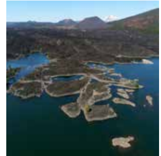
Couverture: Butte lake, Fantastic lava beds, Cinder Cone et au loin Lassen Peak, Parc National de Lassen Peak, Oregon

Infos régulières sur le site www.volcan.ch et sur notre page Facebook «Société de Volcanologie Genève»